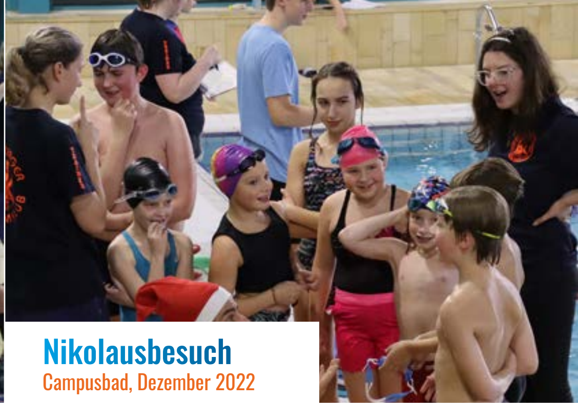
Nikolausbesuch Campusbad, Dezember 2022